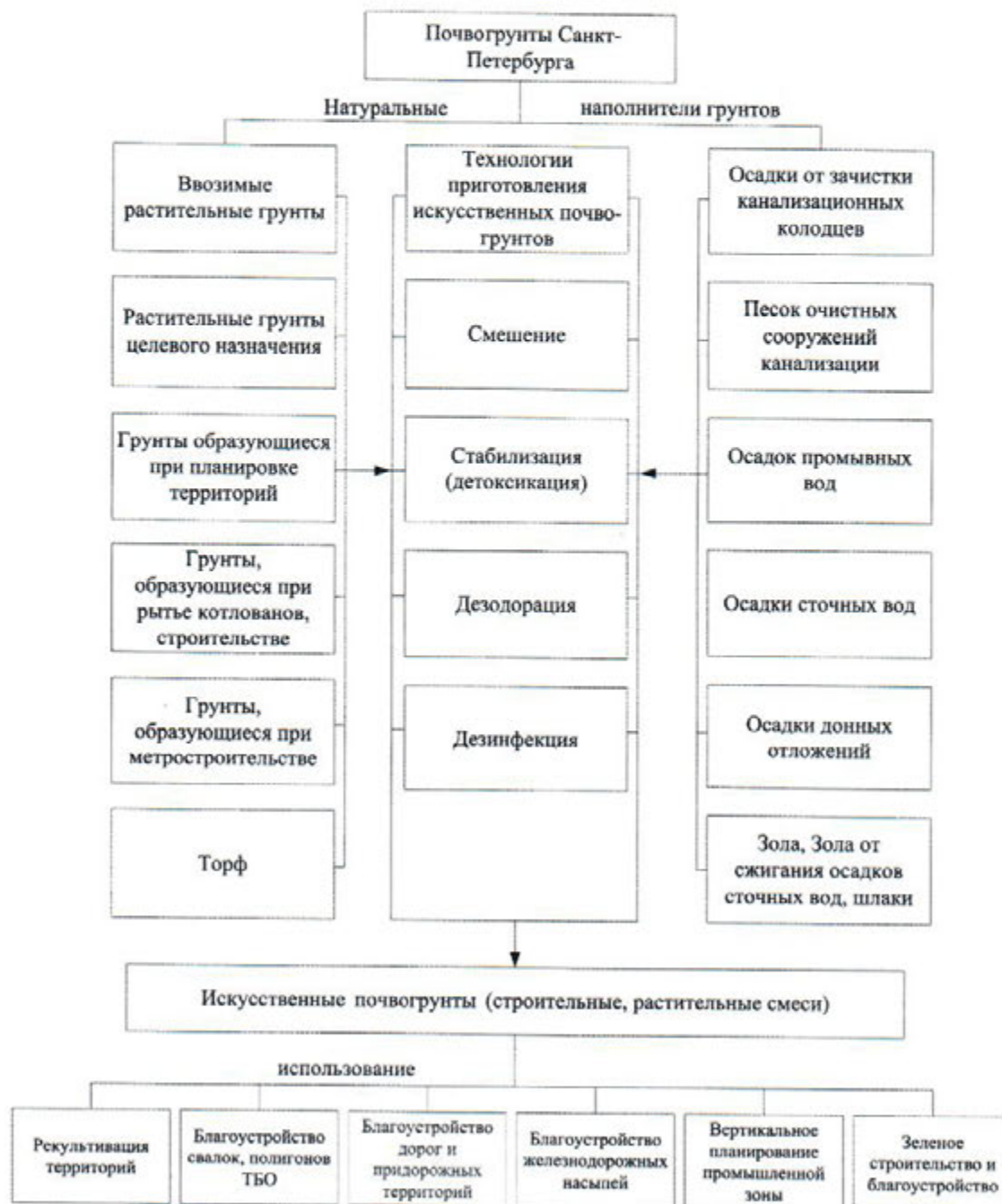
Рис. 1. Схема производства искусственных почвогрунтов (смесей)

При этом контролю при использовании почвогрунтов должны подлежать содержание токсических элементов в подвижных и связанных формах, хими-