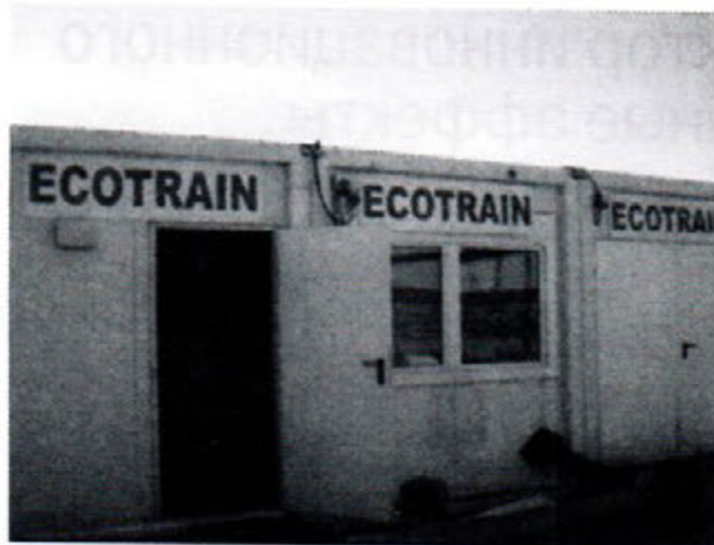
Рис. 3. Общий вид автономного комплекса «Экотрейн»

смешение биошлама с раствором флокулянта, после чего сфлуккулированная суспензия поступает в геотекстильный контейнер (геоконтейнер), где происходит фильтрация воды через фильтровальные отверстия геотекстильного материала.