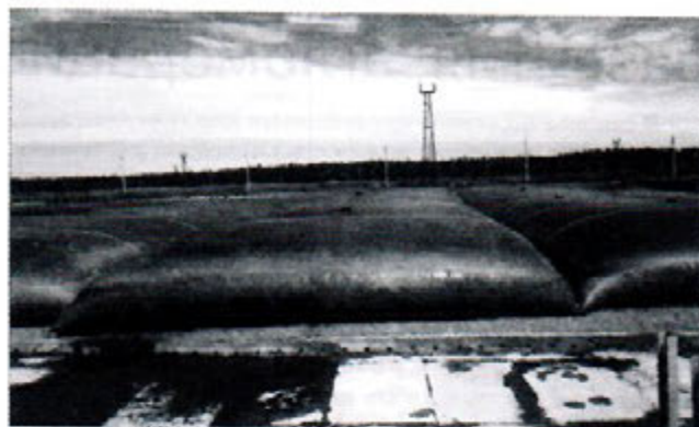
Рис. 4. Общий вид площадки с геоконтейнерами

Полученный методом геотубирования осадок превращается в безопасный субстрат, который можно использовать в качестве компонента для приготовления новых композиционных материалов, заменяющих плодородные грунты.